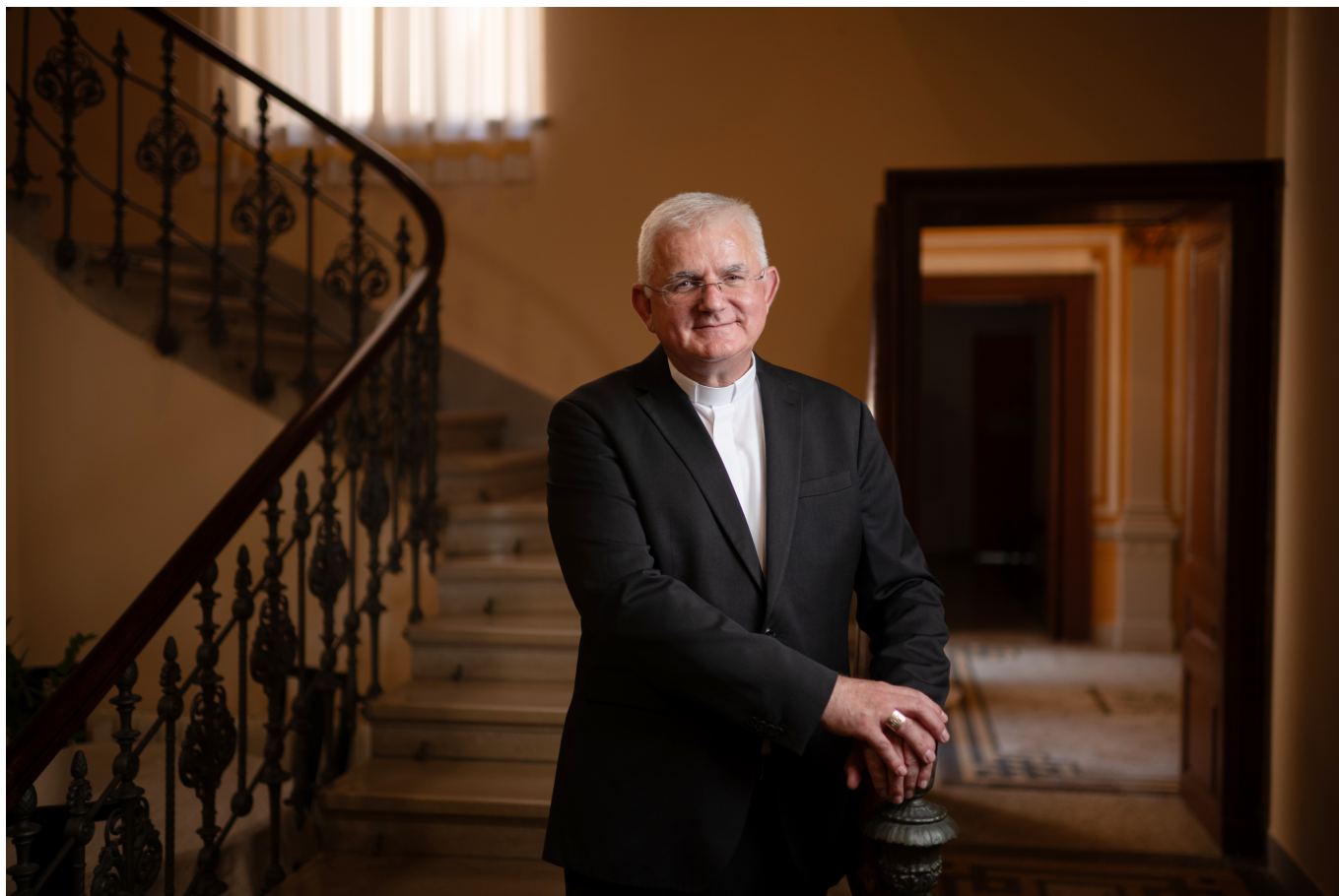
Nadbiskup Mate Uzinić