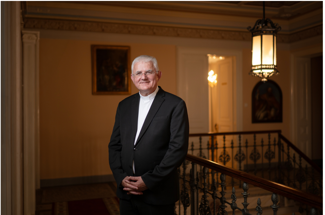
Nadbiskup Mate Uzinić

Ulica nikad nije ni trebala nositi njegovo ime, dodaje. "Da se prije donošenja te odluke vodilo računa o cjelini Šarićeve biografije, vjerojatno se danas ne bismo našli u ovoj polemici. Ona sad, nažalost, ponovno postaje povod za podjele, umjesto za ozbiljno suočavanje s prošlošću."