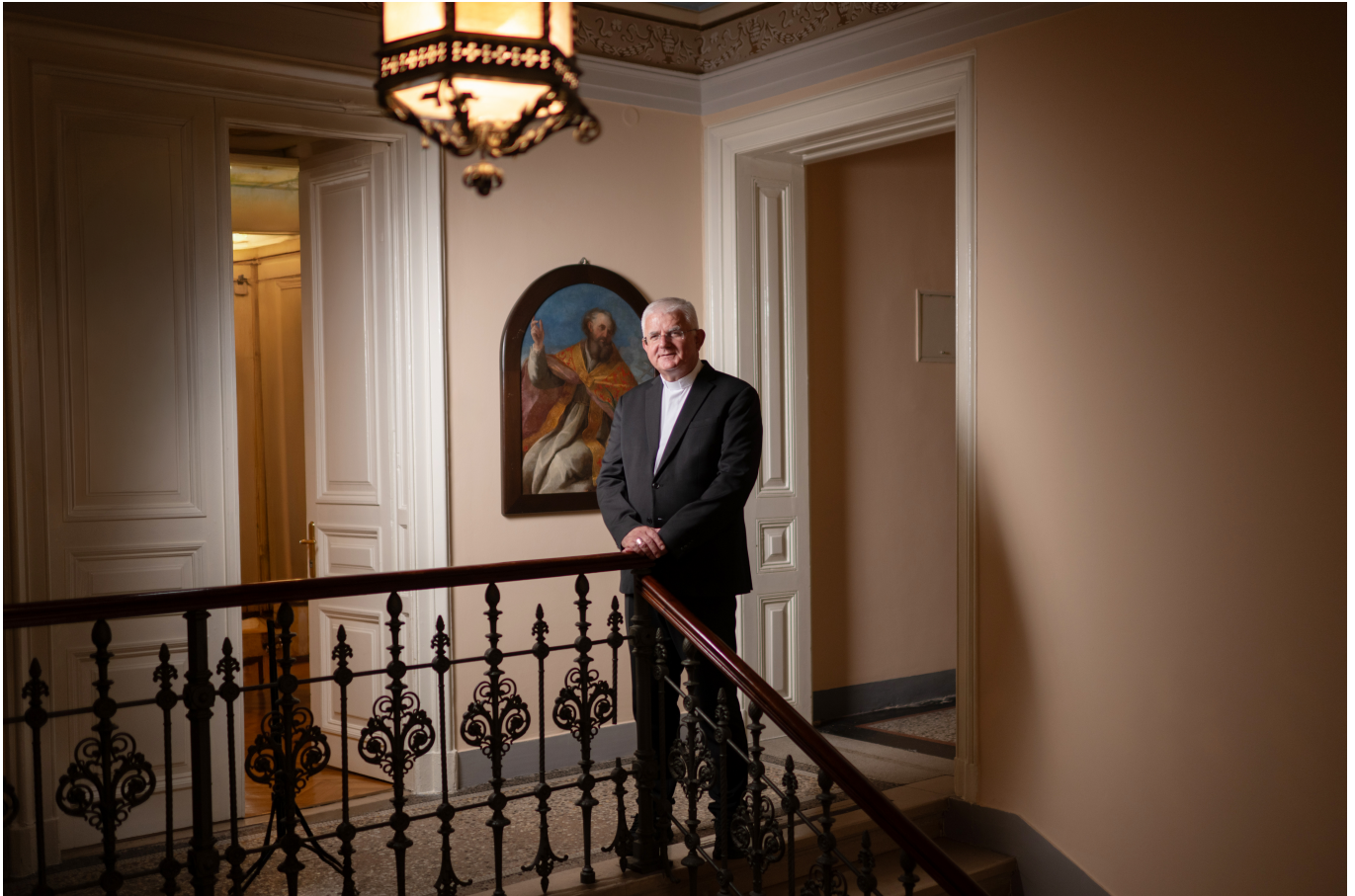
Nadbiskup Mate Uzinić